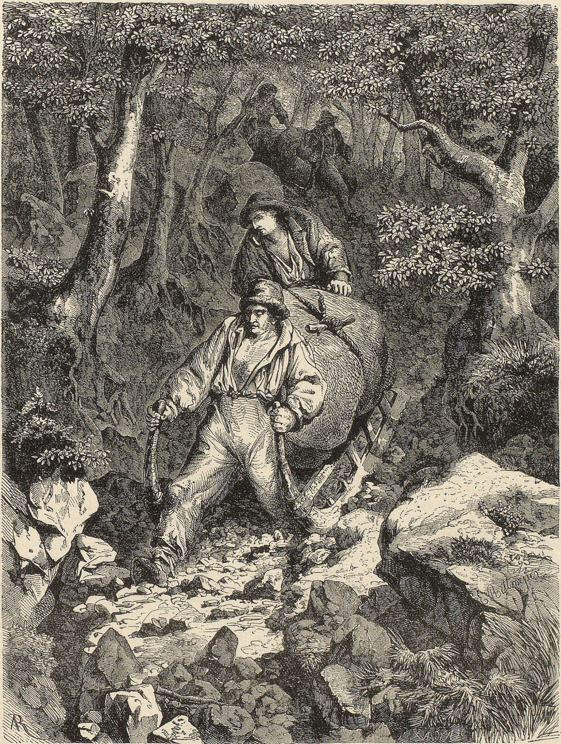
Erzschlitter am Gönzen (nach einem alten Holzschnitt).